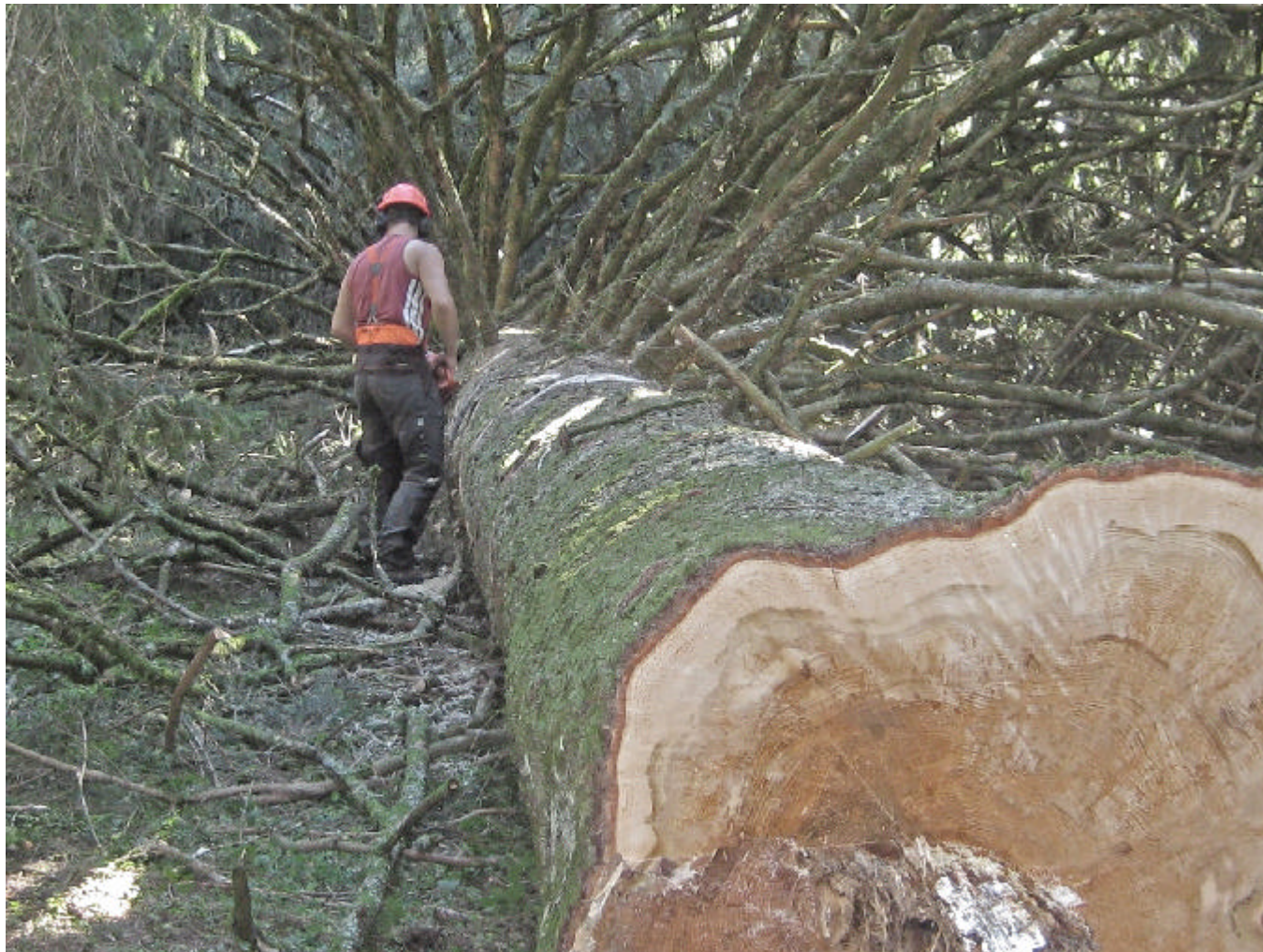
Elagage à la tronçonneuse